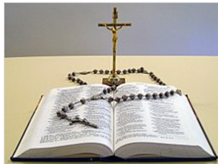
Um típico rosário católico, ladeado por uma Bíblia e por um crucifixo.

O Rosário é uma prática religiosa de devoção mariana muito difundida entre os católicos romanos , que o rezam tanto pública quanto individualmente. Consiste na recitação seriada de orações com o auxílio de uma corrente com contas ou nós, que recebe o mesmo nome. O Rosário também compreende a contemplação de determinadas passagens da vida de Jesus Cristo e de sua mãe, a Virgem Maria , que segundo a doutrina da Igreja Católica são de especial relevância para a história da Salvação e que recebem o nome de "Mistérios"