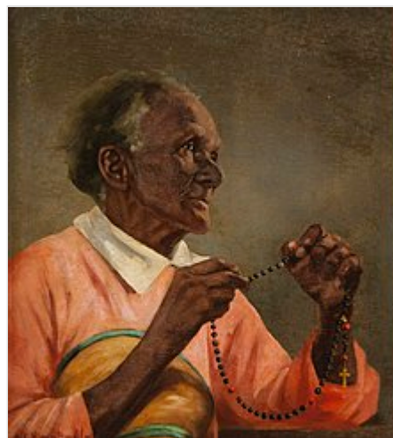
Negra Rezando com Terço , pintura de Adrien Henri Vital van Emelen .

Nossa Senhora também disse ao Bem-Aventurado Alano : “Quero que saibas que, apesar de haver várias indulgências já concedidas ao meu Rosário, acrescentarei muitas mais para cada 50 Ave Marias (cada Terço) para aqueles que as rezarem "devotamente, de joelhos, estando, é claro, livres do pecado mortal". E todo aquele que perseverar na devoção do Santo Rosário, rezando estas orações e meditações, será recompensado por isso; eu lhe obterei completa remissão da pena e da culpa de todos os seus pecados no fim de sua vida. Não sejas descrentes, pensando ser isto impossível. É fácil para mim, pois sou a Mãe do Rei do Céus, e Ele chama-Me 'cheia de graças'. E, sendo 'cheia de graças', posso dispensá-las ao meus filhos.”. [10]